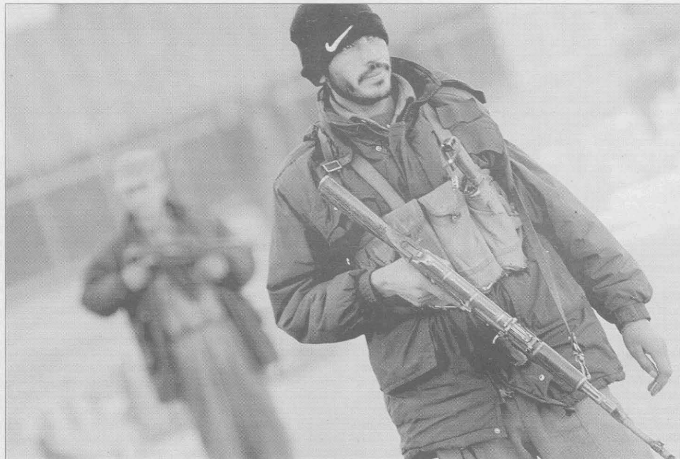
Afgán rendőr Kabulban. A helyi rendfenntartó erők esélytelenül veszik fel a harcot a fegyveres csoportokkal

tor. A húsz-harminc tevével felszerelt csapatnak a több mint négyezer méter magas Spin-Gar hegyvonulaton kellett átjutnia, hogy elérje az orvosi segítségre szorult afgán falvak lakosait. „Kalandvágy, rizikó-vállalás, kíváncsiság nélkül aligha vállalkozik valaki ilyen feladatra. Munkám teljesen törvénytelen volt, a szovjet megszállók nem tűrték külföldi segítségnyújtó munkáját. Damoklész kardja függött feletünk, amikor éjszaka, titokban átléptük a határt. Napközben el kel-